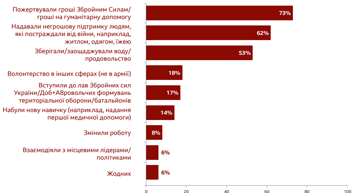
Рисунок 2: Заходи, які вживають жінки для подолання наслідків війни

Питання: Чи робили Ви щось із цього переліку з початку повномасштабної війни?