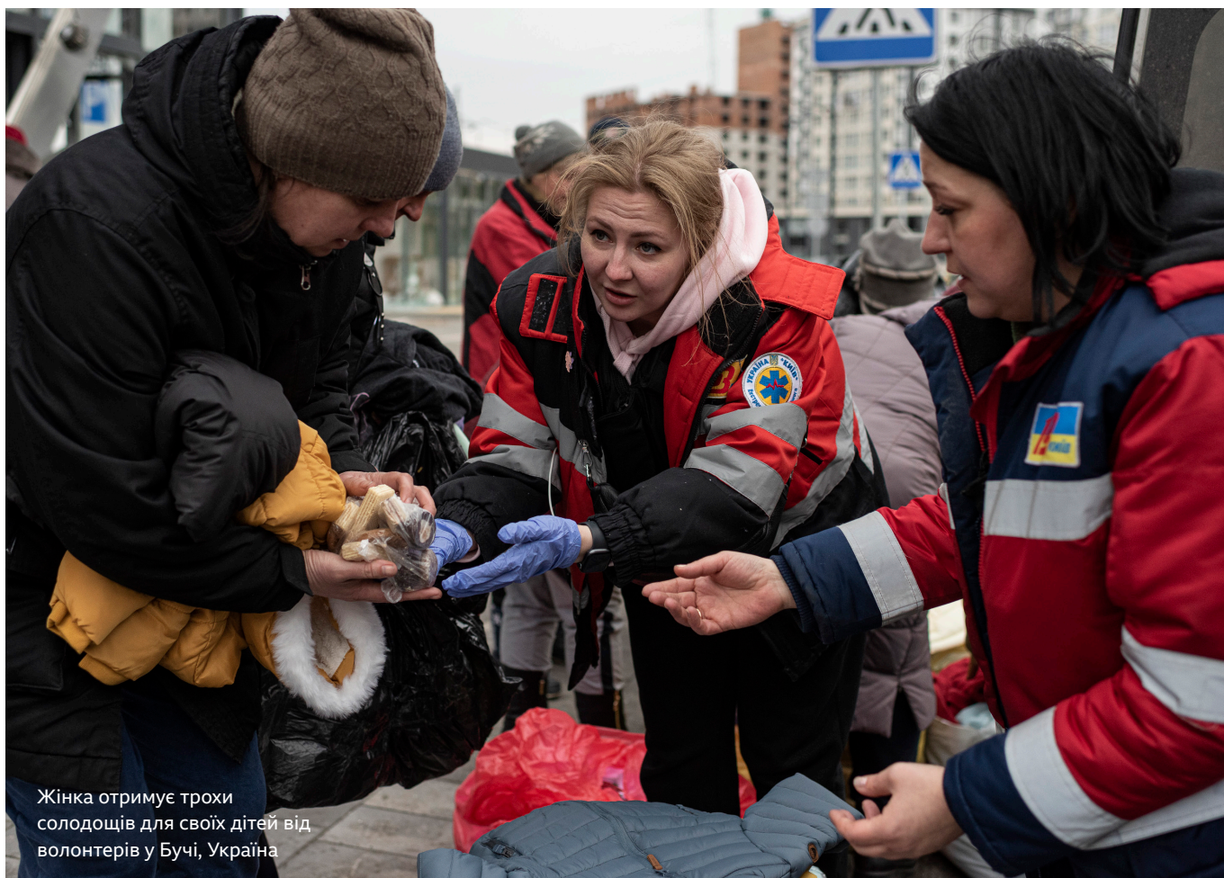
Жінка отримує трохи солодощів для своїх дітей від волонтерів у Бучі, Україна

Цей брифінг ґрунтується на результатах мультимедійного дослідження BBC Media Action, проведеного в Україні наприкінці 2022 - на початку 2023 років. Більшість кількісних та якісних досліджень провела українська дослідницька агенція InfoSapiens. Онлайн-аналіз українського цифрового простору був проведений у квітні 2023 року британською агенцією Discover.ai, яка спеціалізується на використанні штучного інтелекту (ШІ) для сканування онлайн-джерел, а потім залучає людей-аналітиків для отримання інформації про ключові наративи та теми. Потім BBC Media Action триангулює ці дані, щоб отримати комплексну картину того, як змінюються ролі жінок в Україні, як вони обговорюються та подаються в Інтернеті, і як чоловіки та жінки реагують на ці зміни.